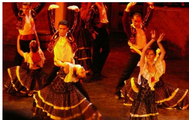
Kraftvolle Melodien, temperamentvolle Tänze.

ßen Ensemble der Verdi-Oper Rousse mit viel Feuer dargeboten: Durch die Choreografie der Balletteinlagen und der Chorauftritte werden die mitreißenden Rhythmen und die hinreißenden, ins Ohr gehenden Melodien in bewegte Bilder umgesetzt. Ein Tipp für alle Genießer: Der Besuch der Oper Carmen im Stadtsaal kombiniert mit einem Candlelight-Dinner im Stadtcafé – nähere Info im Tourismusbüro, Tel. 07672/26644, und im Stadtcafé Vöcklabruck.